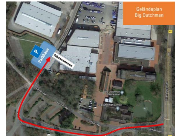
Geländeplan Big Dutchman

Fahren Sie von der A1 an der Abfahrt 63 Cloppenburg auf die B72 Richtung Vechta. An der nächsten Kreuzung rechts abbiegen auf die B69/Hansestraße Richtung Vechta. Nach 4,9 km finden Sie direkt an der B69 auf der rechten Seite das Unternehmen Big Dutchman. Der Weg zum Parkplatz und zum Brückenrestaurant sind ausgeschildert.